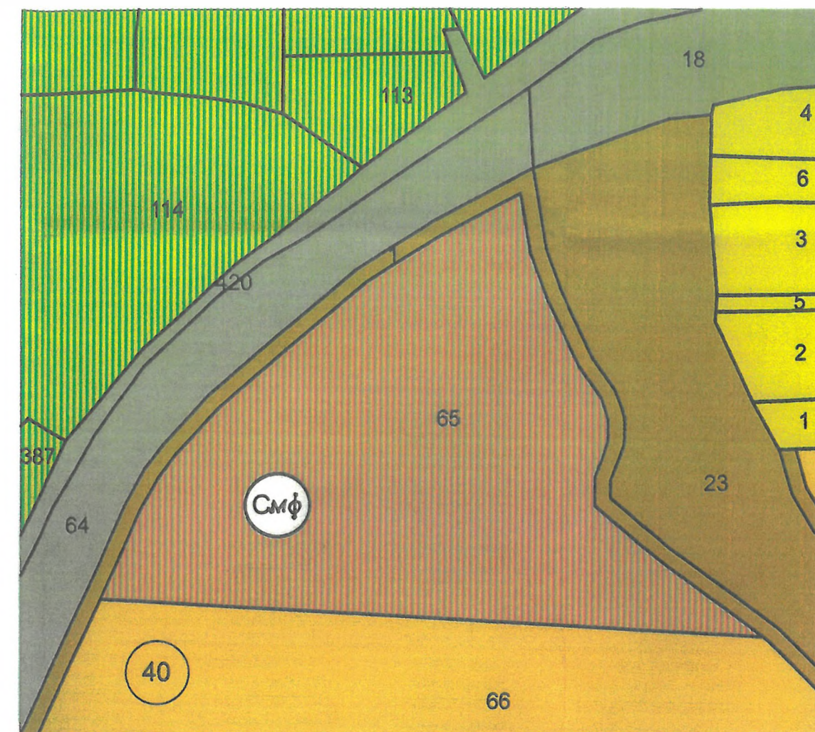
Скица с предложение за изменение на ОУПО Севлиево за ПИ 65927.40.65 по КККР на гр. Севлиево М 1:1000